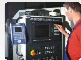
AE-MasterIV im Einsatz zur Maschinendatenerfassung. AE-MasterIV in use for machine data collection.