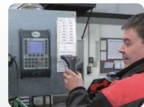
Betriebsdatenerfassung mit externem Barcode-Leser. Production data collection with external bar code reader.

For the control of operations, improvement of cost effectiveness, making accounts and so for ensuring a cost-effective production, companies need to have correct data from order times, machine times, downtime with reasons, process parameters, quality and more. It is guaranteed by electronic operating- and machine data collection.