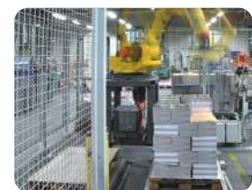
Integrierte Zutrittskontrolle zur Anwendung in der Produktion. Integrated access control for use in production.